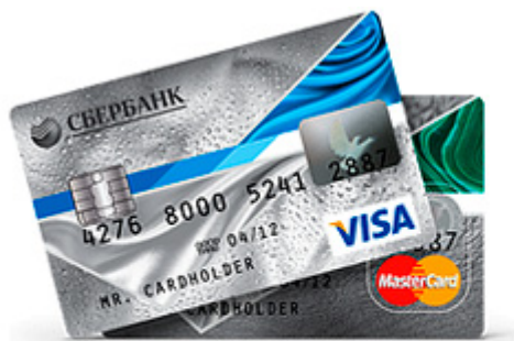
Кредитные карты Momentum