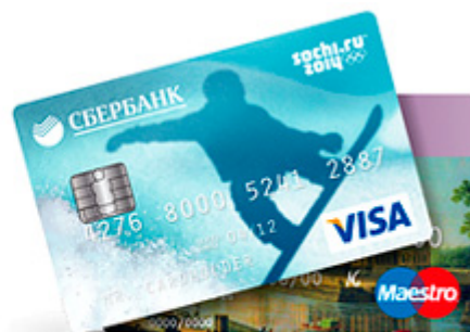
Дебетовые карты Momentum